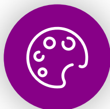
Arts & loisirs créatifs