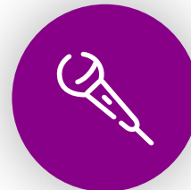
Concerts & festivals