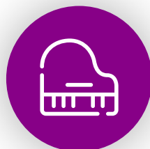
Instruments de musique