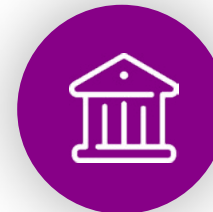
Musées & visites culturelles