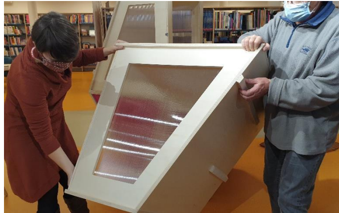
2) Accompagner la descente du bloc jusqu'au sol