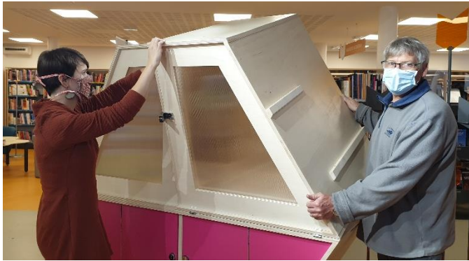
1) Etre deux