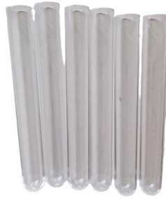
8 tubes à essai