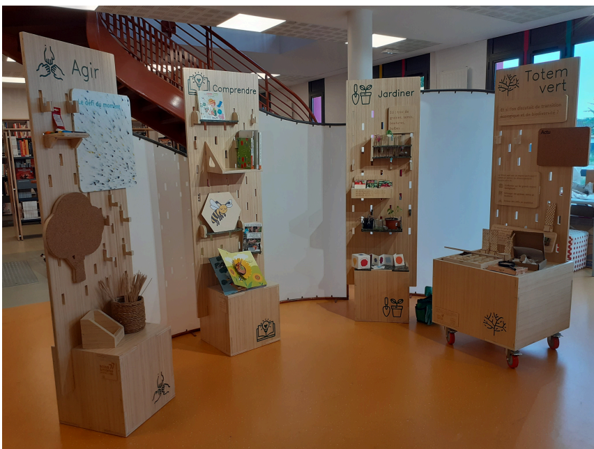
Déployé pour investir les grands espaces

Le Totem vert est modulable. Il se présente de différentes façons.