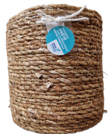
1 panier osier