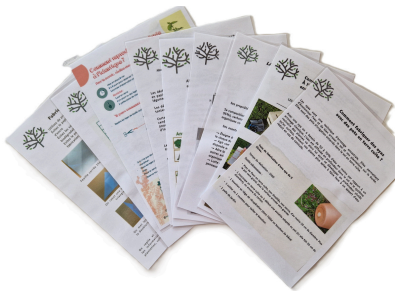
10 fiches pratiques