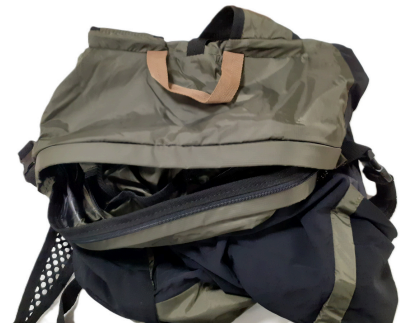
1 sac à dos