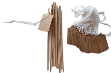
étiquettes + bâtonnets