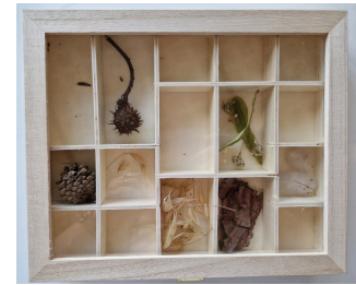
1 boîte à curiosités