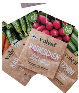
10 sachets de graines