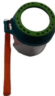
1 loupe à insectes