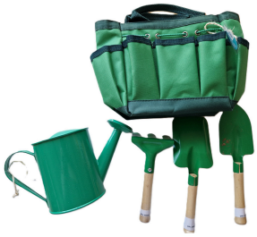
1 sac jardinier + 1 arrosoir + 1 pelle + 1 râtelier