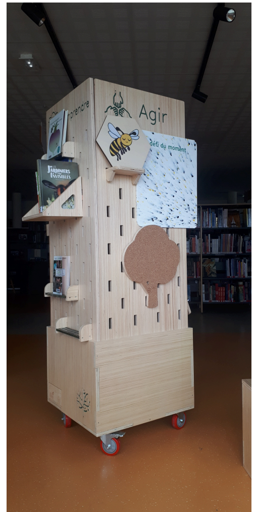
Façon totem pour s'adapter aux petits lieux