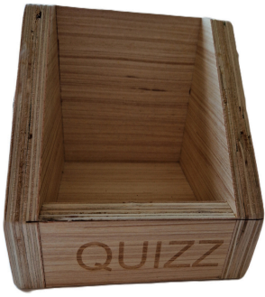
1 boîte à quiz