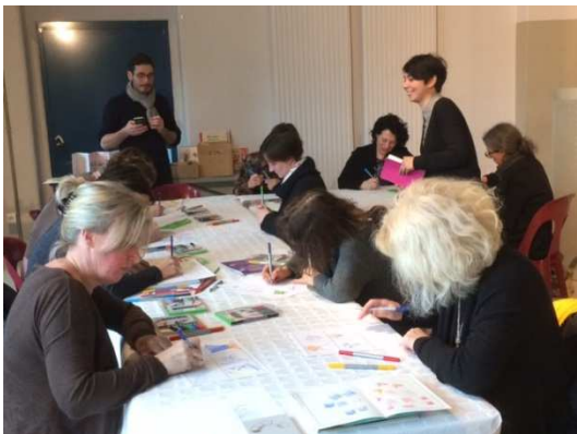
Stagiaires du 15 Février 2018, journée « Osez le Patrimoine »

Dans un premier temps, les stagiaires sont invités à un jeu de dessin dirigé, destiné à lever les appréhensions (« je ne sais pas dessiner ») et à remarquer que la simplification et la spontanéité sont sources de créativité.