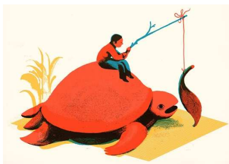
Issun Boshi, éditions Actes Sud