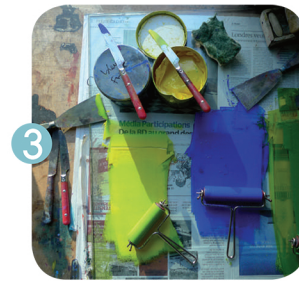
3 Encrage au rouleau