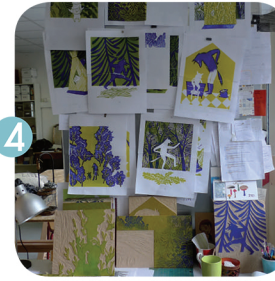
4 On grave une plaque de bois pour chaque couleur