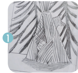
1 Croquis de recherche