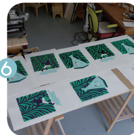
6 Choix des couleurs pour l'impression finale