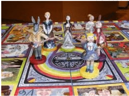
©JEU DE L'OIE DES CONTES