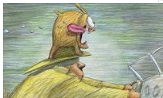
Hot dog / Bill Plympton