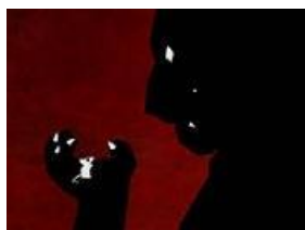
La queue de la souris / B. Renner

Benjamin Renner, doublement oscarisé pour ses longs métrages, est venu présenter son travail et son parcours, qui a emprunté le chemin des Beaux Arts et de La Poudrière, école d'animation à Bourg-lès-Valence.