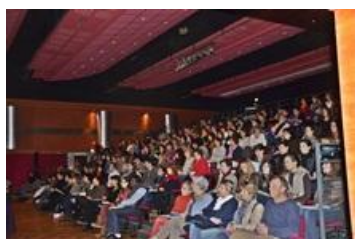
Des auditeurs nombreux et attentifs