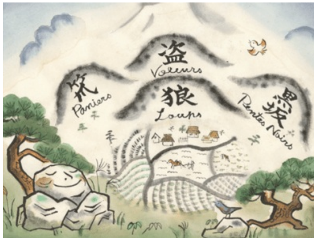
Le Bois des Loups, le Bois du panier et le Bois des Voleurs

Imaginant sa diffusion pour le grand public, elle démarcha plusieurs éditeurs, sans succès. Encouragée par l'auto-éditeur Benoît Jacques, elle se lance alors seule dans la réalisation et la publication de son album Rêve de poisson , puis de son Mini-Kamishibai .